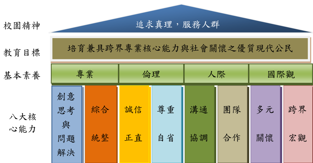
圖 2-1：臺北大學校園發展目標

依據本校中長程（100~104 年）校務發展計畫，校務使命為「培養學生具放眼全球的視野、加強教師的研究能量、強化學生的學習能力、活化臺北校區的資產」。同時，在該 4 項校務使命之基礎上，中長程校務發展計畫的發展願景為「提升各領域教學暨研究表現，成為國內該領域領先發展之系所」。另外，為配合本校 100 年度校務評鑑之辦理，該計畫同時將本校與學生學習相關之校園精神、教育目標、基本素養、八大核心能力等（如圖 2-1）一併納入本校中長程校務發展計畫，期與本校自我定位、校務使命與願景相互呼應，以作為各單位擬定中長程發展計畫之參考。